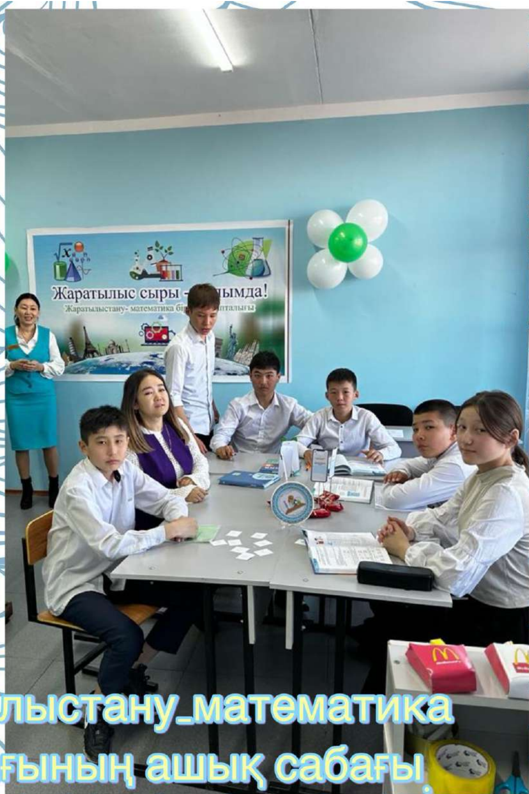
Жаратылыстану_математика апталығының ашық сабағы.